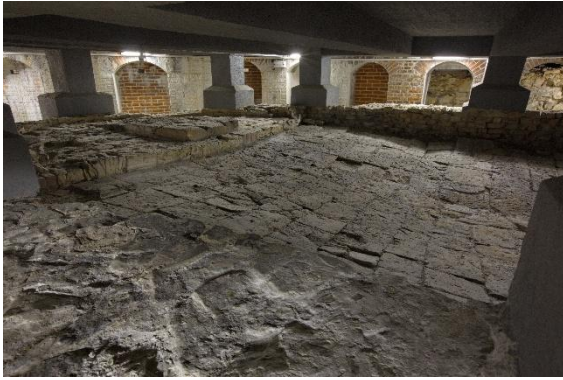
Pražský hrad, vykopávky pod III. nádvořím, pohled do kaple sv. Bartoloměje, současný stav.