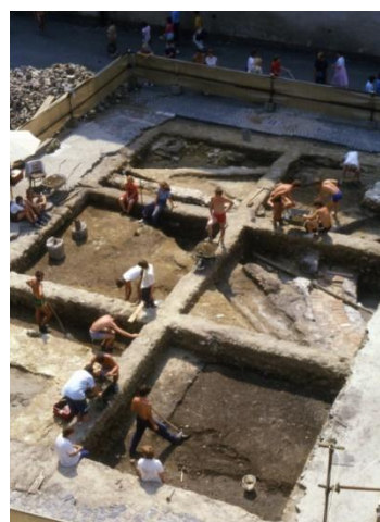
Pražský hrad, vykopávky pod Jiřským klášterem, současný stav.