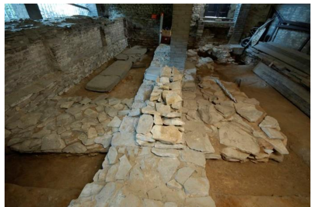
Základ předrománského kostela vedl vnitřkem baziliky sv. Vavřince a zalamoval se v pravém úhlu. Tato zeď zde byla objevena již za První republiky, ale její skutečný význam nebyl tehdy ještě rozpoznán. Dnes je toto starší zdivo zasypáno.