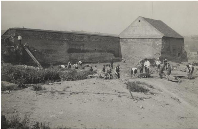
Nejrozsáhlejší výzkum na Vyšehradě probíhal v letech 1924–1936. Fotografie zachycuje výkopy v místě dnešní vyhlídky na Pražský hrad, poblíž pozdější Galerie Vyšehrad.