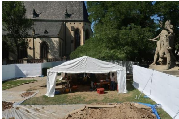
Výzkum dílny na výrobu stříbra a zlata byl položen v parku u jedné z Myslbekových soch v r. 2019.