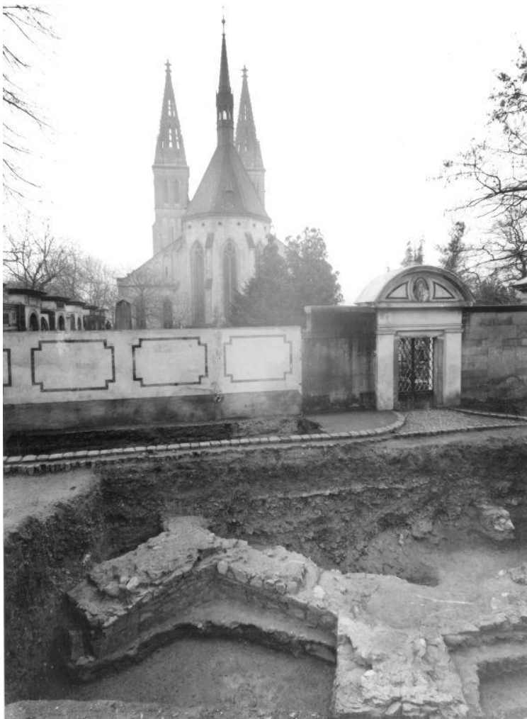
Hned první výkop Bořivoje Nechvátala v r. 1968 byl šťastný: odhalil raně gotický zůvěr kapitulního chrámu, o jehož konkrétní poloze neměl do té doby nikdo tušení.