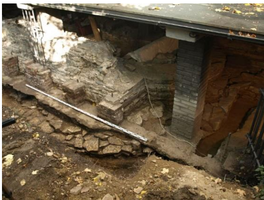
Na svou dobu gigantický předrománský kostel byl objeven pod románskou bazilikou sv. Vavřince. Snímek zachycuje základ jeho jižní obloukové kaple, který byl později překryt sv. Vavřincem.