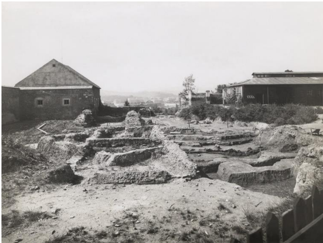
Snímek ukazuje velký rozsah prvorepublikových výkopů, které odhalily řadu nečekaných pozůstatků od 10. století do moderní doby.