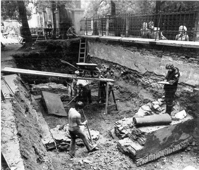
Pokračování románského mostu v místě dnešního hřbitova bylo objeveno v 80. letech 20. století.