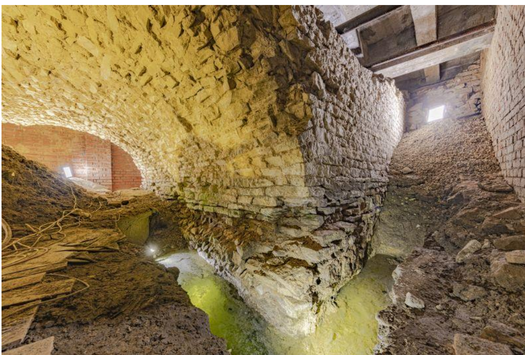
Ověřovací výkop pod obloukem románského mostu – nejstaršího středověkého kamenného mostu ve střední Evropě.