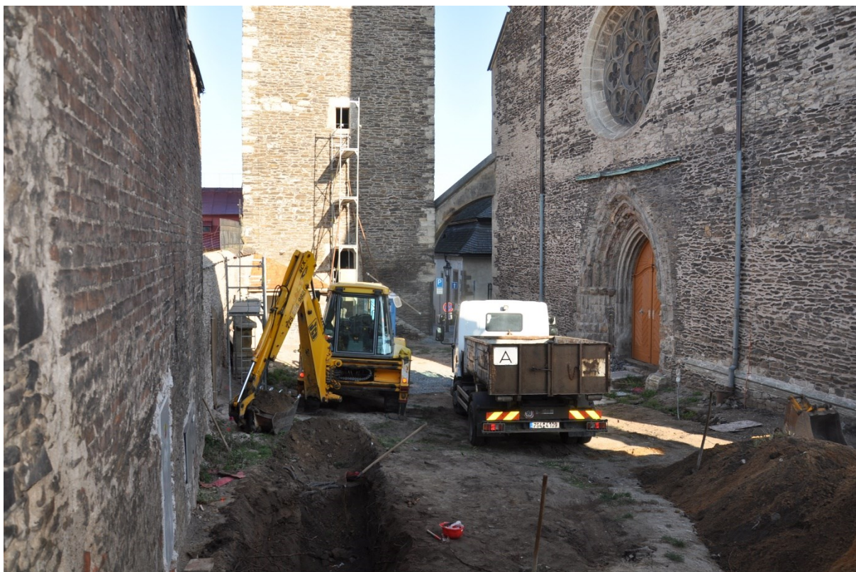
Začátek výzkumu u kostela sv. Bartoloměje v Kolíně (okr. Kolín).