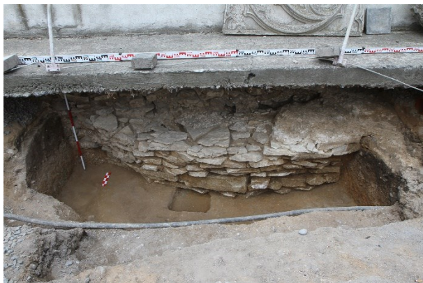
Tisíc let staré zdivo vyšehradského kostela. Pohled na základy severní apsidy, které byly později porušeny stavbou Starého děkanství. ARÚ Praha

Výzkum byl finančně podpořen Grantovou agenturou České republiky.