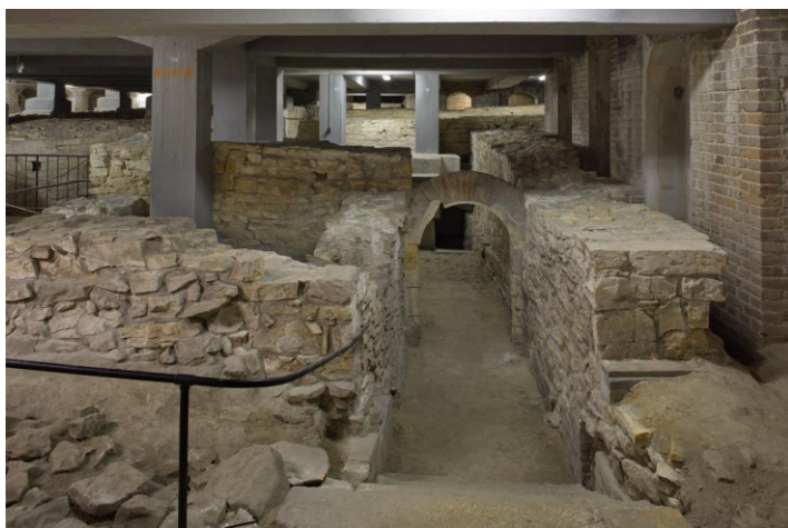
Prostor pod III. nádvořím PH.