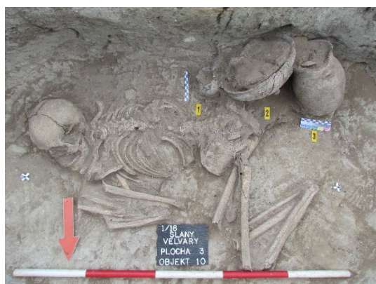
Kosterní pozůstatky z období starší doby bronzové (2300 – 1600 př. n. l.).

Zahájení vlastního výzkumu předcházela náročná přípravná fáze takzvaného nedestruktivního výzkumu, která zahrnovala rešerše archivních pramenů, povrchové sběry a také geofyzikální prospekci, založenou na měření geomagnetických anomálií a dalších fyzikálních vlastností podpovrchových vrstev. Na základě takto získaných informací bylo možné dopředu určit místa s vysokou pravděpodobností výskytu archeologických situací. Přednostně prozkoumané úseky trasy jsou po dohodě se stavební společností co nejrychleji uvolňovány pro stavební práce.